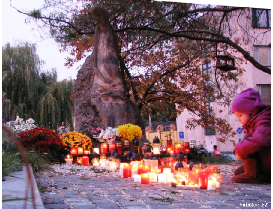
Pamätník nenarodených detí v Nitre