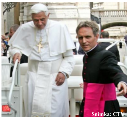
Benedikt XVI. s Mons. Georgom Gänsweinom

Don Giorgio aj naďalej zostáva s emeritným pápežom v jednej