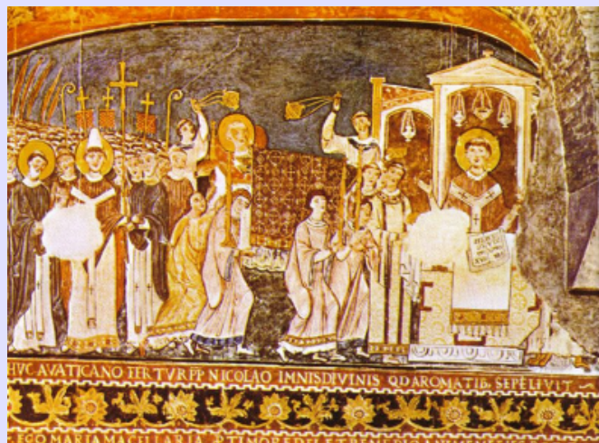
Svätí Cyril a Metod prinášajú ostatky sv. Klimenta do Ríma (freska, 11. storočie, Bazilika sv. Klimenta, Rím)

907 – Víťazná bitka Maďarov pri Bratislave. Rozpad Veľkej Moravy.