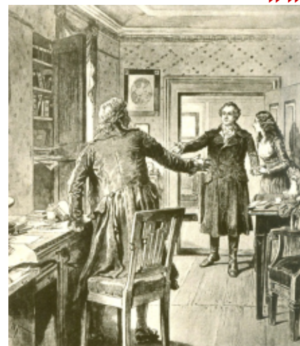
W. Friedrich: Goethe a Schiller