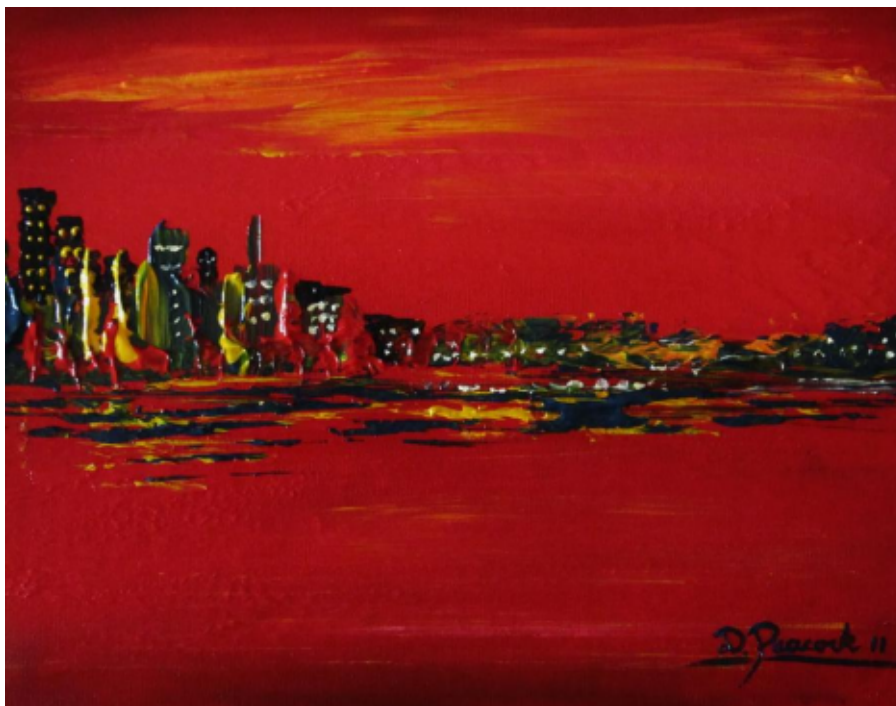
Deborah Peacock: Mesto hriechu

Diabol už dávno nie je trochár. Už prestal mieriť na jednotlivcov, zame-