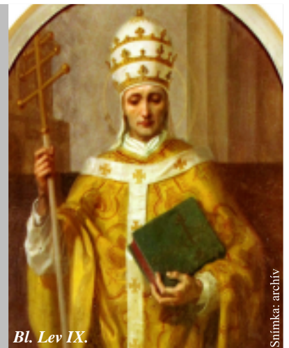
Bl. Lev IX.

Na žiadosť vtedajšieho pápeža blahoslaveného Leva IX. sa začali rokovania medzi Henrichom III. a Ondrejom I. Týchto vyjednávaní sa osobne zúčastnil aj pápež, ktorý vtedy, t.j. v roku 1052 navštívil Bratislavu. Aj napriek jeho prítomnosti však k dohode nedošlo. Henrichovo vojsko však muselo odísť, keď sa obrátnemu potápačovi Zotmundovi podarilo potopiť na Dunaji kotviace cisárovo lode s potravinami a s výzbrojou. Mier uzavreli – vďaka pápežovmu sprostredkovaniu – až v roku 1053, keď sa Uhri zaviazali zaplatiť výpalné a opäť potvrdiť odstúpenie územia medzi riekami Litava a Morava, čo bolo dohodnuté už mierom v roku 1043.